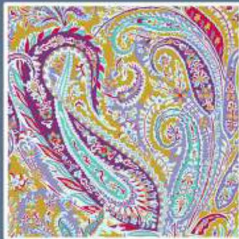
LIBERTY COL. 07