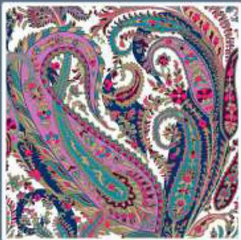
LIBERTY COL. 06