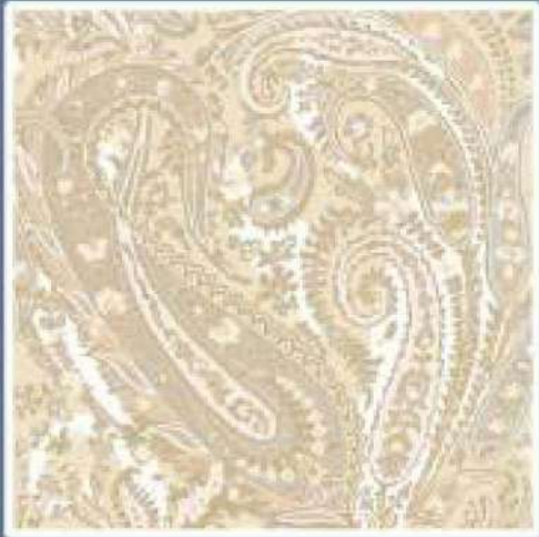
LIBERTY COL. 01