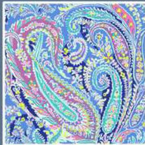
LIBERTY COL. 08