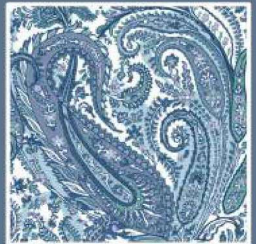
LIBERTY COL. 10