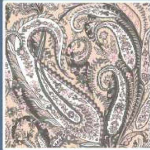
LIBERTY COL. 03